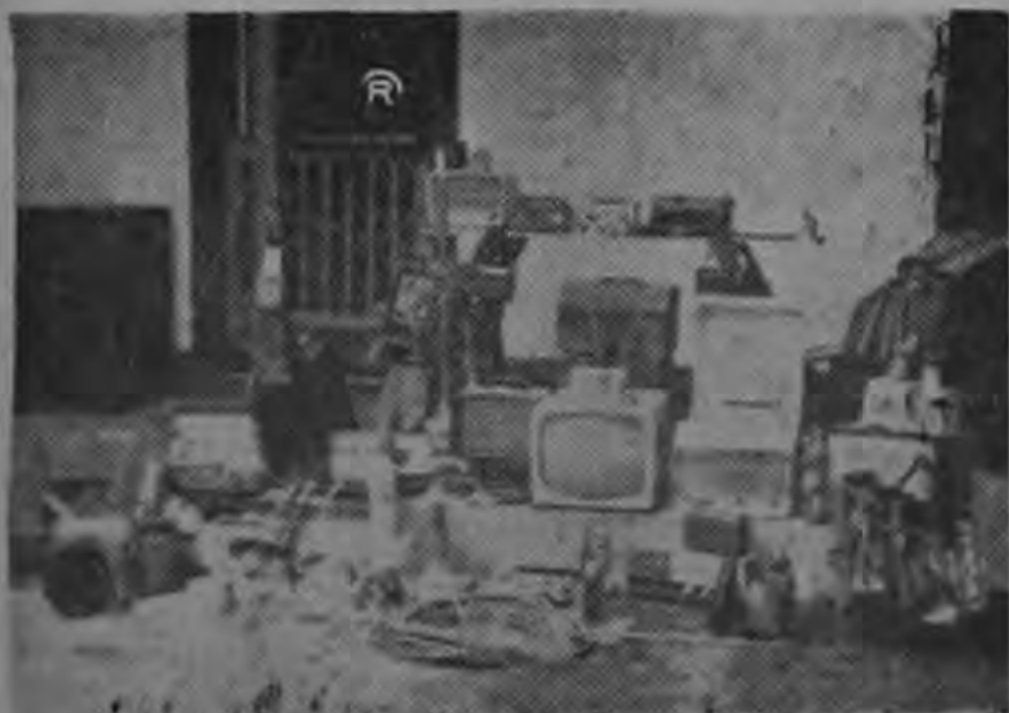
PAR DEL ENORME BOTIN encontrado anteayer en el barrio Fátima de Guadalupe, en casa de un individuo apellidado Jaén, quien admitió que todo lo había comprado a hampones. Los detectives estiman que en la casa había unos 11 mil colones en objetos robados.