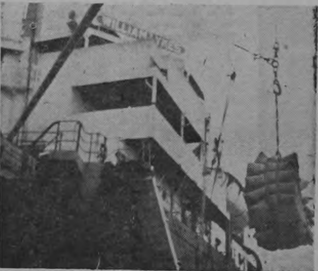
Momento en que bajaban el primer cargamento de Sorgo que el pueblo de los Estados Unidos obsequió a los damnificados del Iracú. El barco "William Likes" es la primera vez que llega al país y su amarre al muelle fue lento. Se aproximaba la noche cuando se tomaron estas fotos exclusivas de LA REPUBLICA.