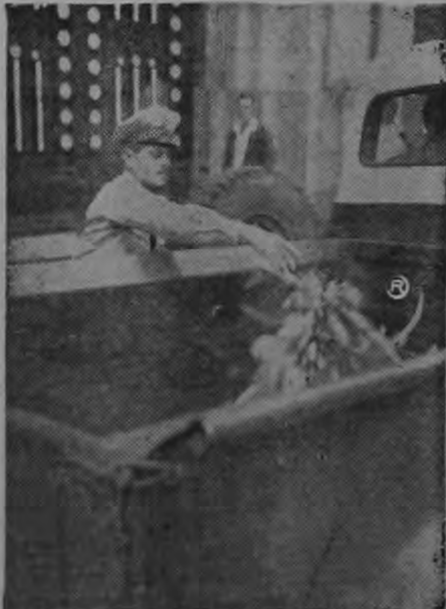
GUARDIA MUNICIPAL RECOGE MERCANCIAS — Al mediodía de ayer la Guardia Municipal de San José decomisó gran cantidad de mercancías en las inmediaciones del Banco Central, a vendedores ambulantes que se dedicaban a este comercio sin contar con el correspondiente permiso. La mercadería decomisada era en su mayoría frutas y matas, que más tarde fueron devueltas a sus dueños. De volver a reincidir, dijeron las autoridades, estos artículos serán entregados a una institución de beneficencia.