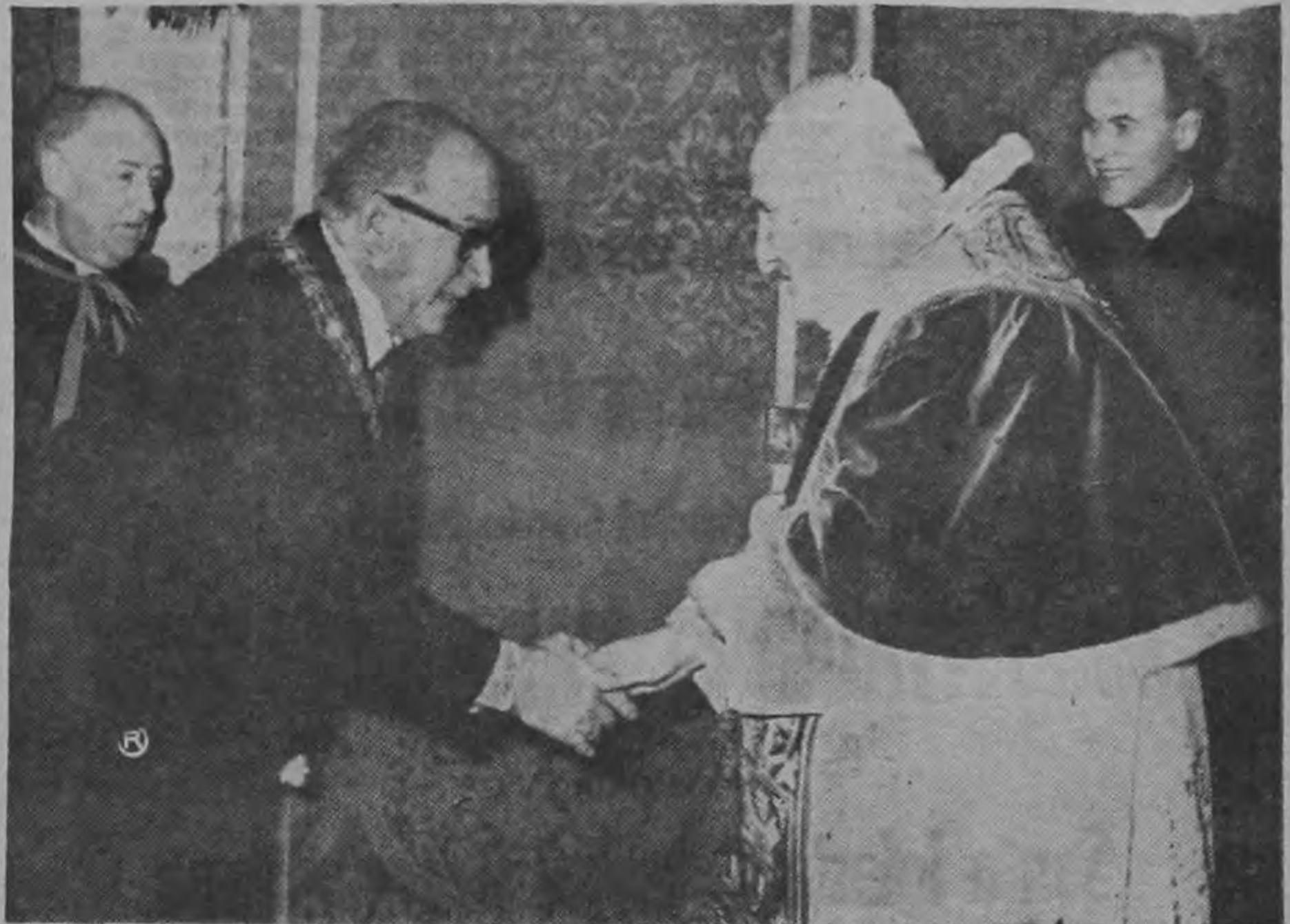
GRAFICA que cobra actualidad. El Sr. Presidente de la República don Francisco Orlich estrecha la mano de su Santidad Juan XXIII en el Vaticano. La visita ocurrió durante la gira que el Sr. Presidente Orlich efectuó por Europa, poco tiempo después de haber sido electo. Con ellos dos altos Dignatarios del Vaticano.