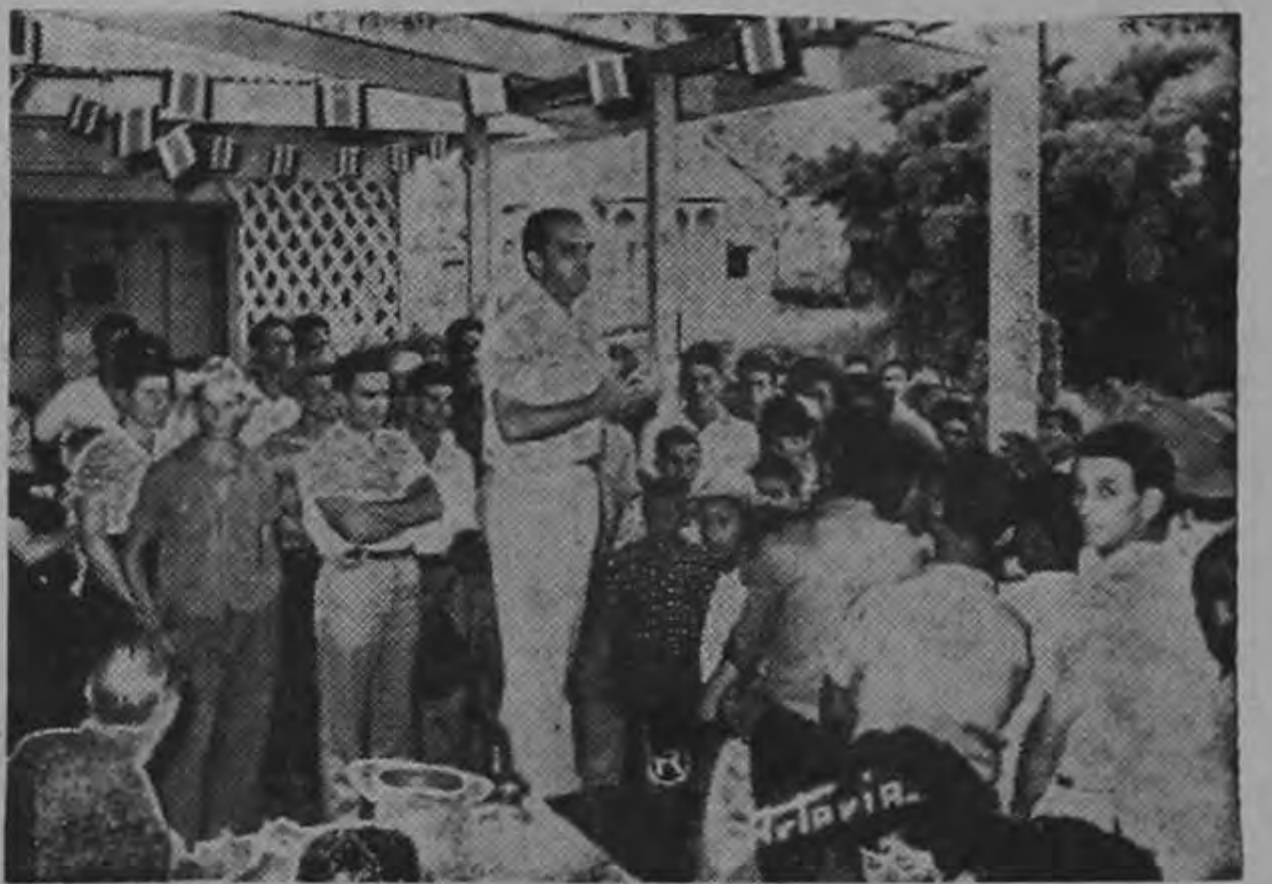
El Lic. don Daniel Oduber Ministro del Exterior que acompañó al Sr. Presidente en su jira por Puriscal, dirigiendo la palabra a los vecinos de Mercedes Sur, a donde se trasladaron. El Sr. Oduber expuso la importancia de los caminos de penetración y reconoció el esfuerzo de la Junta de Caminos Vecinales para cumplir con la misión encomendada.